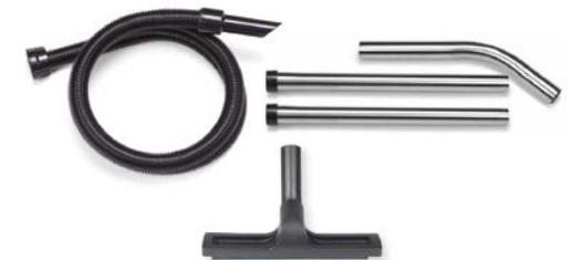
Zubehörset AA5 des WV800-2