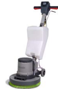
Umfangreiches Sonderzubehör verfügbar