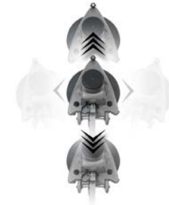
Drei Laufräder für gute Manövrierbarkeit